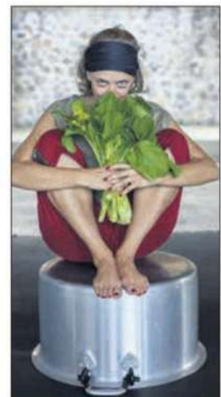
«Dan mon marmit», une ode aux saveurs créoles.