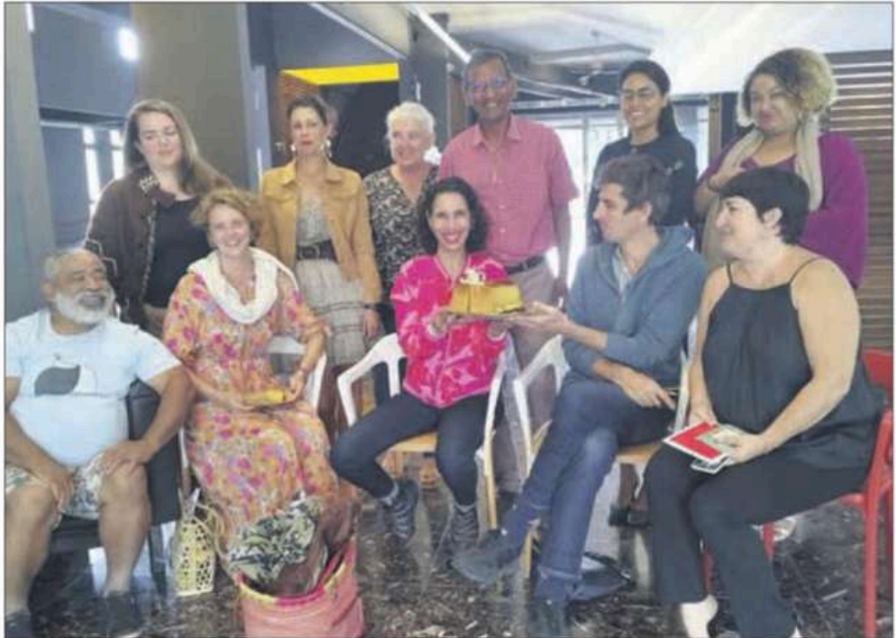
La collégiale des organisateurs du festival réunie autour d'un gâteau d'anniversaire pour la 20 e édition. (Photo Jean-Rémy Moulouma / Les Bambous).

20 ans plus tard, la situation n'a guère changé, mais le festival s'est installé dans le paysage. Il propose cette année 6 spectacles et associe 12 structures dans 10 communes : le théâtre Les Bambous à Saint-Benoît, les services culturels de Bras-Panon et Sainte-Suzanne,