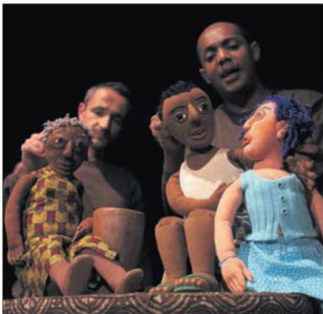
«Banawassi la malice», des marionnettes qui nous font voyager aux Comores.